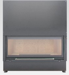
KWLINE E 1500 G