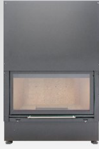
KWLINE E 1000 G (opcja R)