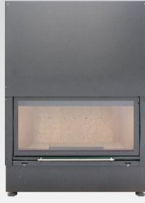
KWLINE E 1200 G