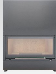
KWLINE E 1300 G