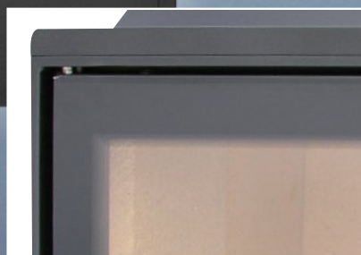
Drzwiczki bezramowe z pełną szybą - tzw. raster - opcja

Wkład KWLINE E 1000 występuje również w wersji o wysokości fasady: 560 mm - opcja.