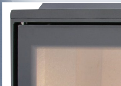
Drzwiczki bezramowe z pełną szybą - tzw. raster - opcja