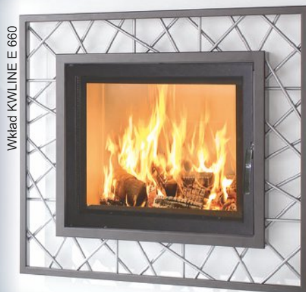
Wkład KWLINE E 660

Wkład KWLINE E 660 występuje również w wersji o wysokości fasady: 560 mm - opcja