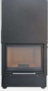
KWLINE E 660 G (opcja R)

Nie mamy ambicji być największą na świecie firmą kominkową produkującą największą ilość modeli wkładów - lecz chcemy być najlepsi - to prawdziwa domena i hasło przewodnie KWLINE