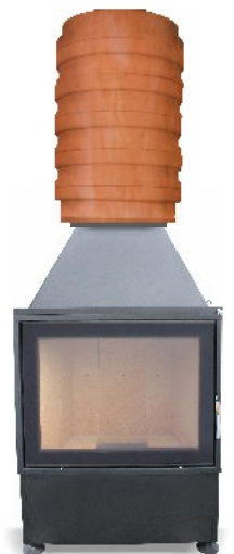
KWLINE E 660 R (raster) - opcja

Aksesoria akumulacyjne - ringi (dla wkładów: E 440VCZ, E 550V, E 660, E 660 R, E 660 RCZ, E 780)