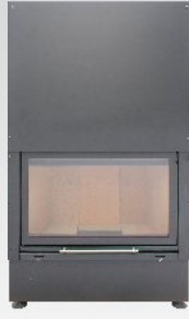
KWLINE E 780 G (opcja R)