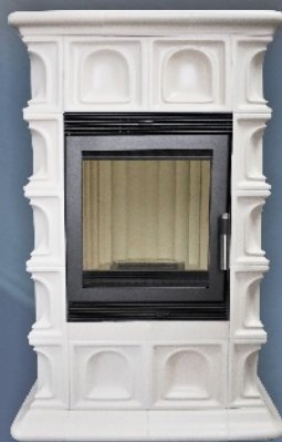
HANNOVER - BIAŁY