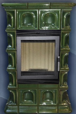
HANNOVER - ŚREDNIA ZIELEŃ