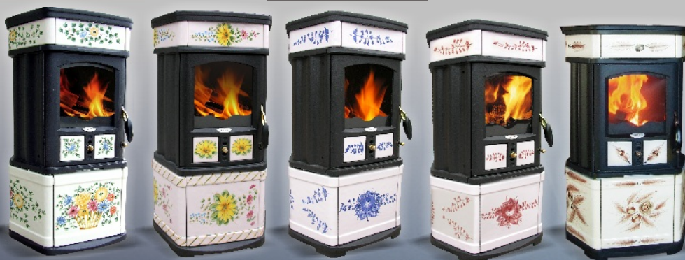
Monellina 176 NL Primavera