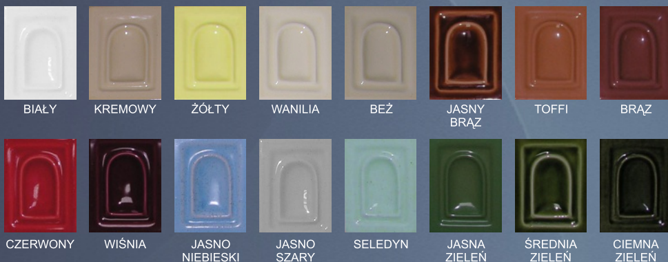
BIAŁY KREMOWY ŻÓŁTY WANILIA BEŻ JASNY BRĄZ TOFFI BRĄZ CZERWONY WIŚNIA JASNO NIEBIESKI JASNO SZARY SELEDYN JASNA ZIELEŃ ŚREDNIA ZIELEŃ CIEMNA ZIELEŃ