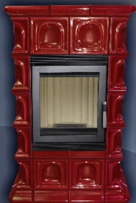
HANNOVER - CZERWONY