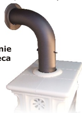
Podłączenie górne pieca

Komora spalania pieca jest wyłożona materiałem izolującym - Thermotte. Materiał ten podwyższa temperaturę spalania w komorze paleniska przyczyniając się do poprawienia sprawności urządzenia.