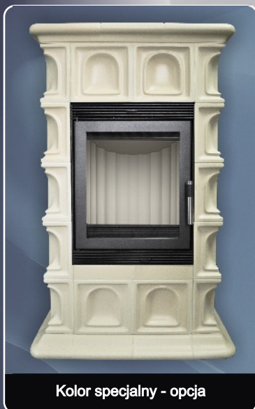
Kolor specjalny - opcja