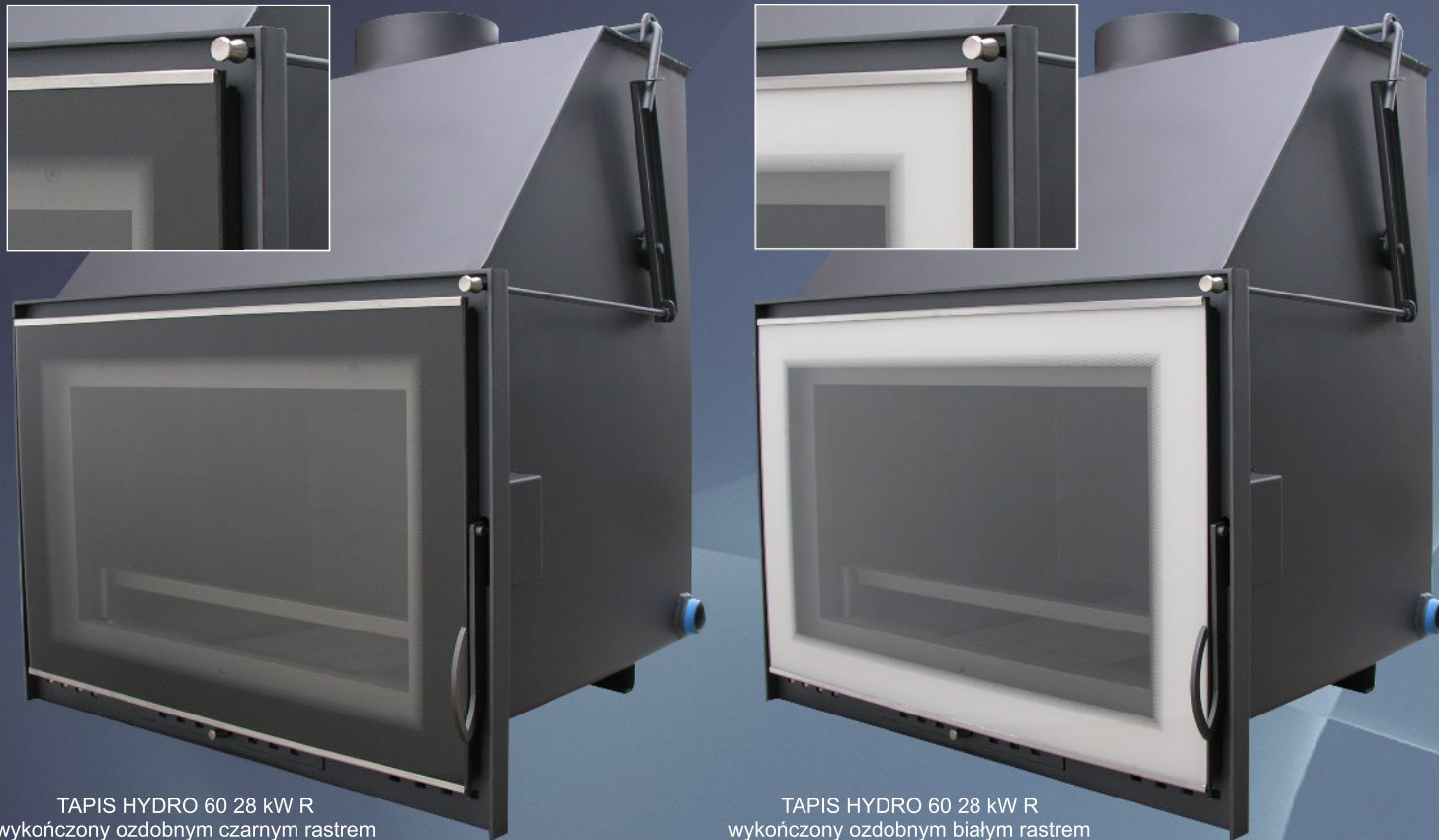
TAPIS HYDRO 60 28 kW R wykończony ozdobnym czarnym rastrem