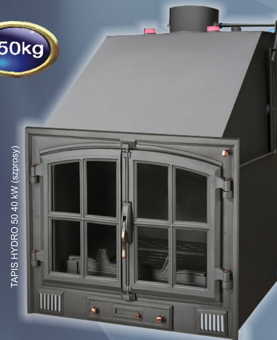
TAPIS HYDRO 50 40 kW (szprosły)