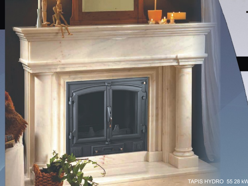
TAPIS HYDRO 55 28 kW