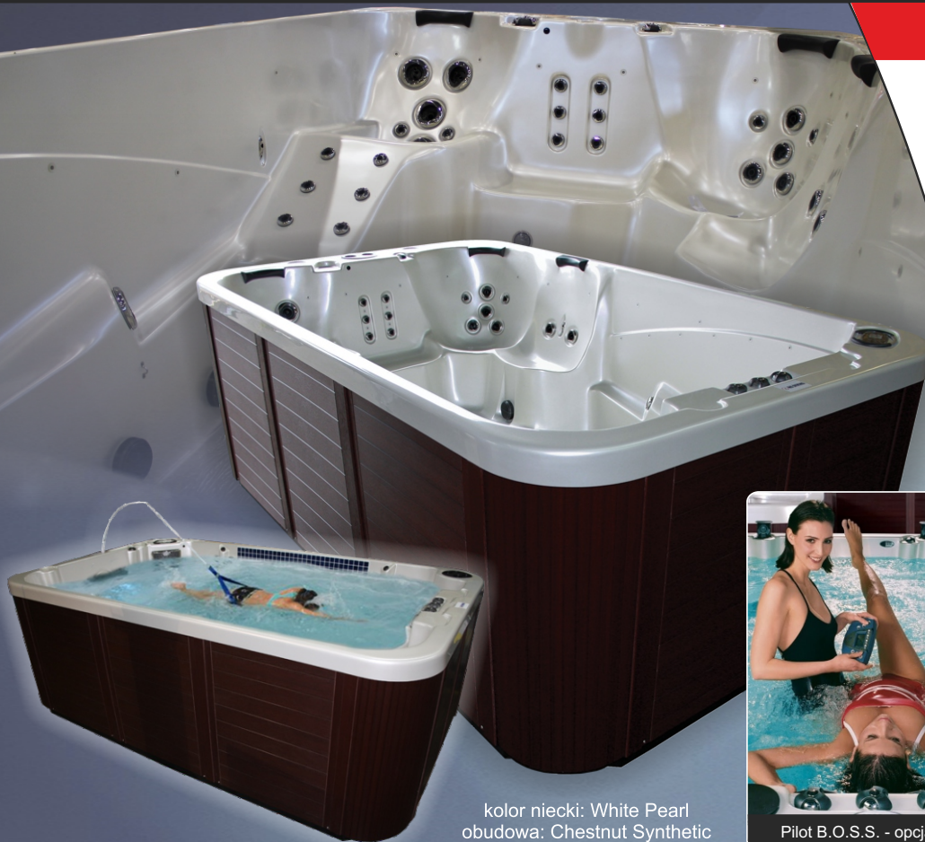
kolor niecki: White Pearl obudowa: Chestnut Synthetic