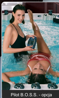
Pilot B.O.S.S. - opcja