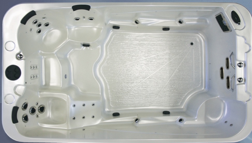
wymiary: 3830 x 2890 x 1340 mm waga: 953 kg (pusta)

Pompy Hi-Flow, w połączeniu ze specjalnie wyprofilowanymi, chromowymi dyszami, odpowiadają za silny, stały przedni prąd.